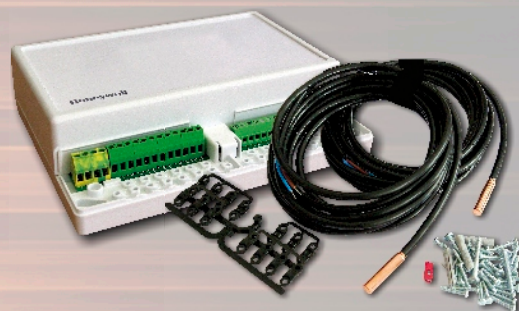
Obsah balení SZ10004